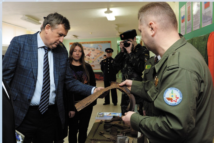
Подведение итогов областного смотра - конкурса музеев образовательных организаций Ленинградской области, посвященного 70-летию Победы в Великой Отечественной войне, МБОУ «СОШ № 3» г. Сосновый Бор. 4 февраля 2015 г.