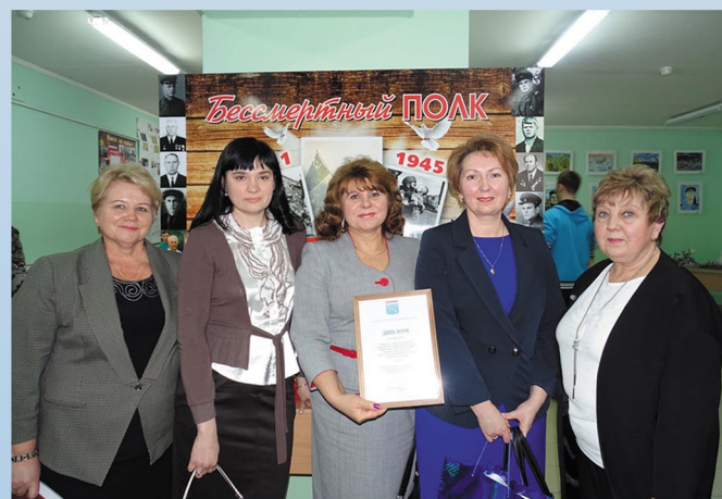
Подведение итогов областного смотра-конкурса музеев образовательных организаций Ленинградской области, посвященного 70-летию Победы в Великой Отечественной войне, МБОУ «СОШ № 3» г. Сосновый Бор. 4 февраля 2015 г.