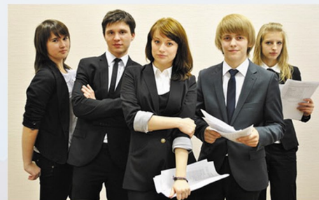
Выпускники Кировской гимназии, прошедшие обучение по индивидуальным образовательным маршрутам

Выбор индивидуального маршрута может осуществляться в трёх направлениях: осмысление дальнейшего пути получения образования, повышение функциональной грамотности по предмету, совершенствование в выбранной сфере деятельности.