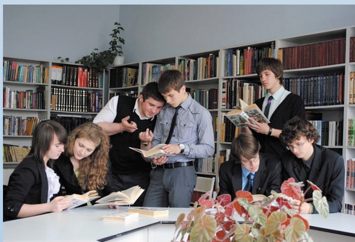
Учащиеся гимназии самостоятельно работают в библиотеке над индивидуальными проектами, 2014–2015 учебный год