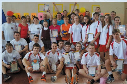
СПОРТИВНЫЙ ПРАЗДНИК «ДЕНЬ ВОЛЕЙБОЛА», МБОУ «Подпорожская СОШ № 8». 21.03.2015 г.