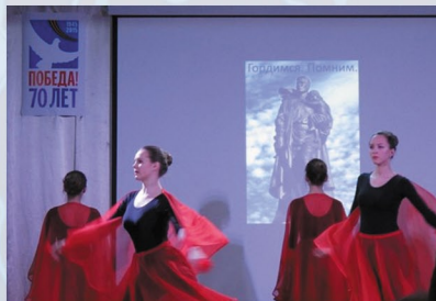
ФЕСТИВАЛЬ «ВОЛШЕБНЫЙ КАЛЕЙДОСКОП», посвященный 70-летию Победы, МБОУ «Подпорожская СОШ № 3». 17.04.2015 г.