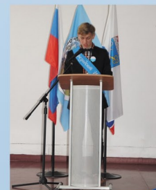
Ролевая игра «ВЫБОРЫ ПРЕЗИДЕНТА ШКОЛЬНОГО ПАРЛАМЕНТА» МБОУ «Подпорожская СОШ № 8» 23.09.2014 г.