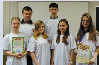
БРЕЙН-РИНГ по истории Великой Отечественной войны, посвященный 70-летию Великой Победы. 25 марта 2015 г., г. Подпорожье