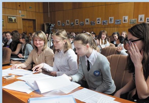
Работа пресс-центра на 14 НПК «Подросток в современном мире». 16.05.2015 г.