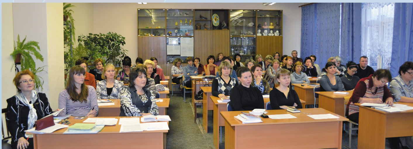
МОУ "СОШ № 2" г. Всеволожска. Педагогический совет по теме «От эффективного контракта учителя к эффективному образованию», 27 октября 2014 г.